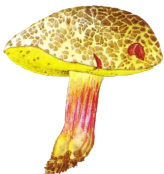
HŘIB ŽLUTOMASÝ (BABKA)